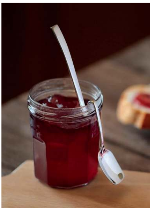
Cuillère à confiture Aurora