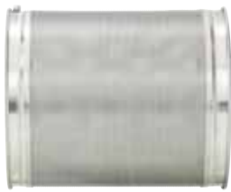
1 mm (En standard)