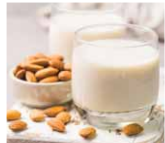
BOISSONS VÉGÉTALES (NOIX DE COCO, AMANDES...)

Pour plus d'applications, consultez votre responsable régional.