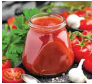
TOMATES, POIVRONS, COMPOSITE DE POMMES...