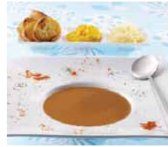
SOUPE DE POISSONS, CRUSTACÉS...