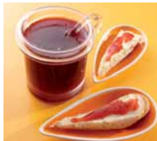
FRUITS ROUGES, CHÂTAIGNES, ...