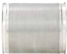
0,5 mm Destiné à filtrer les fibres et impuretés les plus fines. S'utilise en complément du tamis 1 mm.